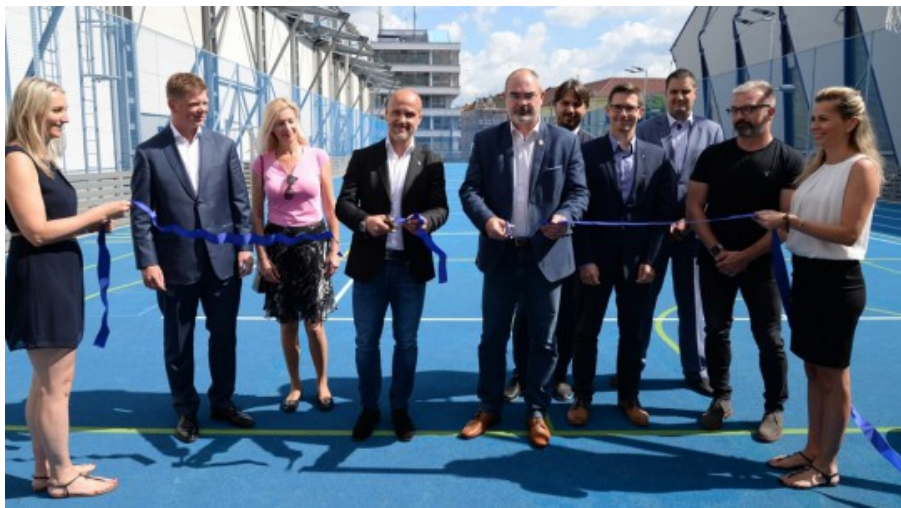
Slavnostní stříhání pásky na novém hřišti za účasti vedení města i hokejového klubu

Víceúčelové hřiště pro mladé hokejisty nechalo vybudovat město Plzeň. Nové sportoviště o rozměrech 20 x 67 metrů za zhruba 11 milionů korun stojí mezi zimním stadionem a malou tréninkovou halou v lokalitě Doudlevice. Moderní zázemí budou využívat malí hokejisté, ale i mladí talenti, kteří navštěvují plzeňskou hokejovou akademii. Primárně tak bude hřiště sloužit 250 až 300 dětem a mladým lidem. Součástí komplexu pro hokejisty se v budoucnu stane ještě i ubytovna akademie s tělocvičnou.