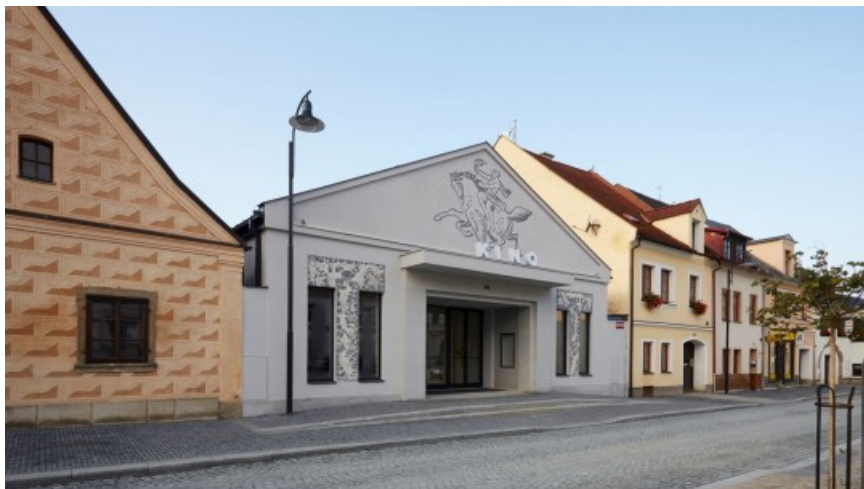
Vítězné KINONEKINO v Plané soutěžilo v kategorii rekonstrukce budov | Autor: Stavba roku

Stavbami roku Plzeňského kraje 2017 se staly bývalé kino v Plané na Tachovsku, přestavěné na multifunkční kulturní zařízení KINONEKINO, a komplex bytových a řadových domů Na Dražkách v Plzni-Újezdě. V 15. ročníku soutěžilo 19 staveb v šesti kategoriích. Cenu sedmičlenné odborné poroty si odnesla nová smuteční síň v Plané, veřejnost pak rozhodla svých hlasováním o stavbě století, kterou se stal Zimní stadion v Plzni.