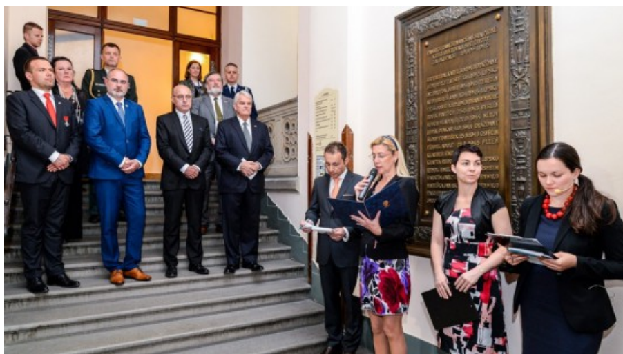
Setkání vedení města s velvyslanci USA a Belgie

Připomínat si myšlenky Václava Havla, udržovat jeho odkaz a mít na paměti zdůrazňování svobody a demokracie, to je důležité pro současnou českou společnost. Shodli se na tom v neděli dopoledne na společném setkání na plzeňském radnici velvyslanec Spojených států amerických v České republice Stephen B. King, velvyslanec Belgického království v České republice Grégoire Vardakis, primátor města Plzně Martin Zrzavecký (ČSSD) a jeho první náměstek Martin Baxa (ODS). Setkání se uskutečnilo v rámci končících Slavností svobody.