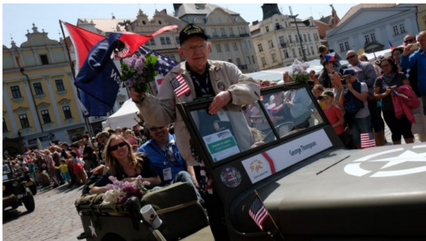
Slavnosti svobody 2018 | Autor: Richard Beneš

Dvacet tisíc diváků všech věkových kategorií sledovalo v sobotu dopoledne podél Klatovské třídy a později i na náměstí Republiky tradiční a oblíbenou přehlídku historických i současných vojenských vozidel Convoy of Liberty. Bez této jízdy, které se na džípech zúčastní také američtí i belgičtí veteráni, pamětníci osvobození Plzně, si asi Slavnosti svobody nedokáže nikdo představit. Nad konvojem přeletěly také dvě stíhačky Gripen Armády České republiky a legenda druhé světové války britská stíhačka Spitfire i cvičný letoun Harvard.