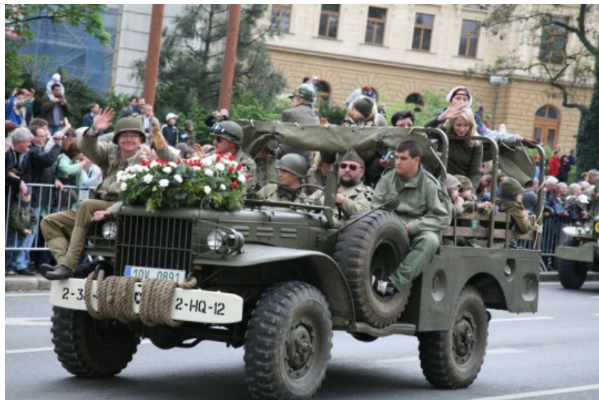
Slavnosti svobody si vyžádají některá dopravní omezení

Několik dopravních omezení v Plzni si vyžádají Slavnosti svobody v době od 3. do 6. května. Dotknou se jak silniční, tak i městské hromadné dopravy. Největší opatření se dotknou náměstí Republiky, kde bude po celou dobu konání slavností platit zákaz parkování podél západní, východní a jižní strany náměstí. Dojde také k úplným uzavírkám vjezdů na náměstí v odpoledních a večerních hodinách. Dne 4. května bude uzavírka od 18.00 do 23.00 hodin, 5. května kvůli průjezdu konvoje již od 8.00 do 23.00 hodin a 6. května od 12.00 do 21.00 hodin. Vjezd městské hromadné dopravy a obsluhujícím vozidlům bude povolen.