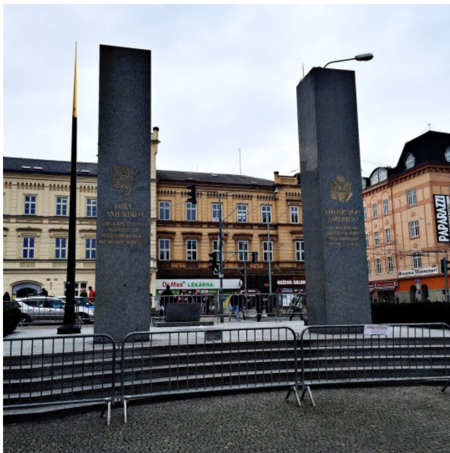
Památník Díky Ameriko obehnaný zátarasý se zákazem vstupu

Tradiční vyvrcholení květnových oslav osvobození Plzně u pomníku Díky Ameriko je vážně ohroženo a nelze vyloučit, že pietní akt se uskuteční u loni odhaleného památníku generála George Pattona. Důvodem jsou nebezpečně velké trhliny v obou dvanáctitunových pylonech památníku, které se tam nedávno objevily. Výsledky měření odborníků nyní potvrdily, že stav žulových kvádrů není vůbec dobrý. Nabízí se dvě varianty, jak situaci vyřešit. Buď pomník opravit, neustále jej sledovat a investovat další peníze, nebo jen zbourat a vybudovat repliku. Každopádně památník je nyní obehnan zátarasý se zákazem vstupu, protože hrozí jeho zřícení.